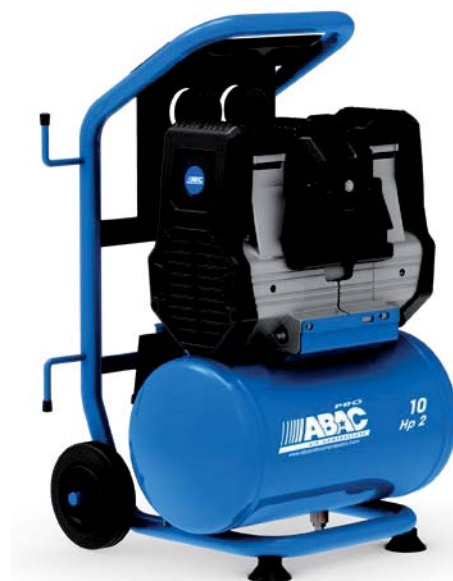
10RM - vzdušník 10 litrů