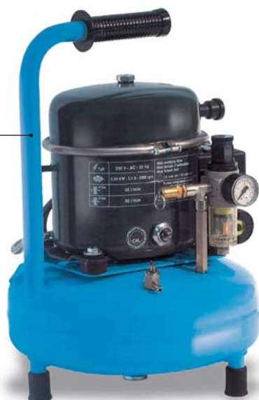
AP50-9RM 340 W, vzdušník 9 litrů

Prodloužená rukojeť s pryžovým madlem zajišťuje maximálně komfortní manipulaci