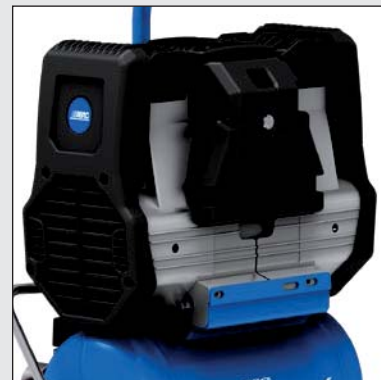
Odhlučněná jednotka se 2 písty a centrálně uloženým motorem