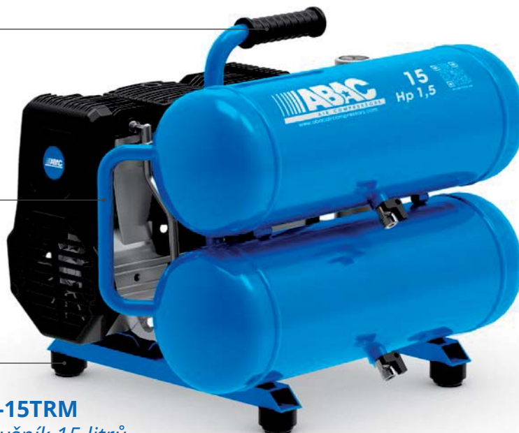
OS15P-1,1-15TRM 1,1 kW, vzdušník 15 litrů

Pryžové podstavce pro snížení přenosu vibrací