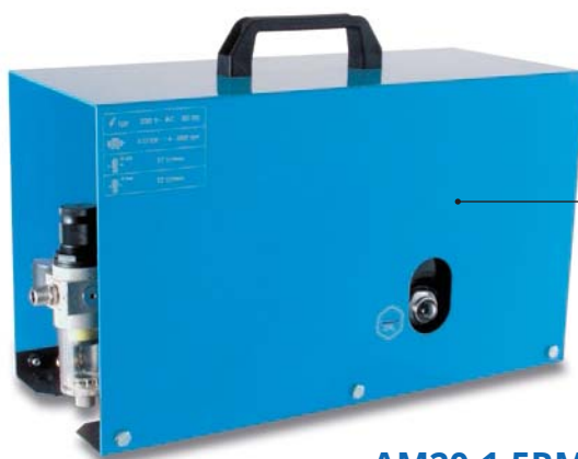
AM20-1,5RM 130 W, vzdušník 1,5 litru