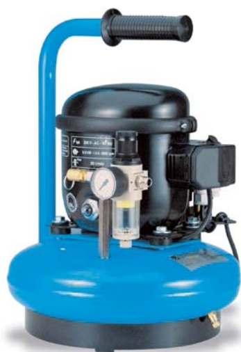
AJ30-6RM 190 W, vzdušník 6 litrů