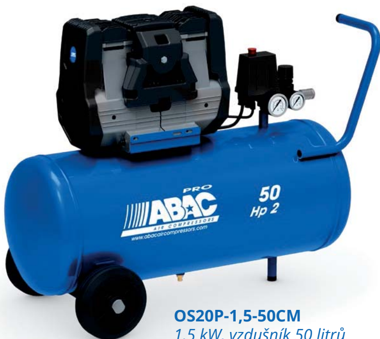
OS20P-1,5-50CM 1,5 kW, vzdušník 50 litrů

Tlakový spínač, regulátor tlaku, 2 manometry a výstup přes rychlospojku