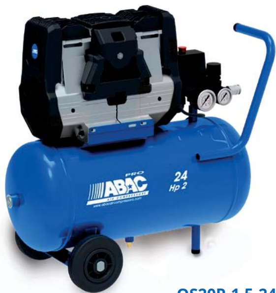
OS20P-1,5-24CM 1,5 kW, vzdušník 24 litrů