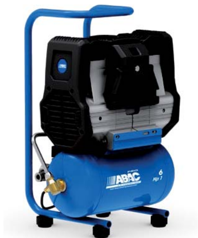
6RM - vzdušník 6 litrů

Kompresory z řady Super Silent Line splňují všechna kritéria pro moderní malý pístový kompresor - odhlučněné provedení bez drahého krytu, bezolejové, s přímým pohonem s nízkými otáčkami a v mnoha uživatelsky přívětivých konfiguracích.