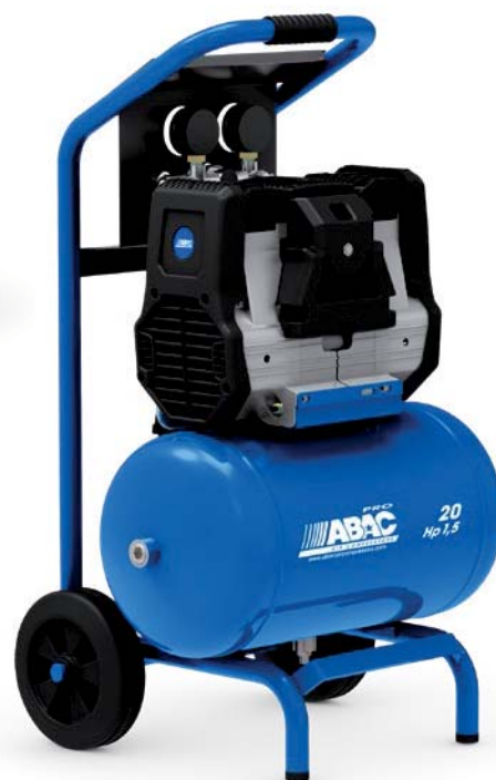
20RM - vzdušník 20 litrů